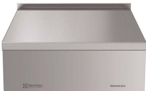
588566 (MBNABBG000) thermaline 85 - 700 mm CLOSED WORK TOP, 1SIDE OPERATION WITH BACKSPLASH